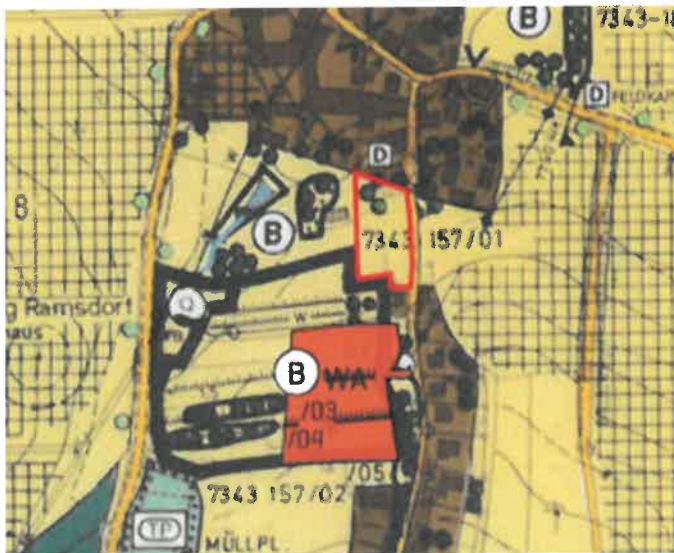
FINr. 36, Gemarkung Ramsdorf

Lageplan zum Flächennutzungsplan DB 12.1 und 12.2