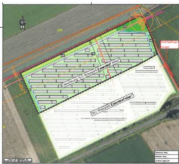
Lageplan zum B-Plan ← „Erweiterung SO Solarpark Eisenstorf West“