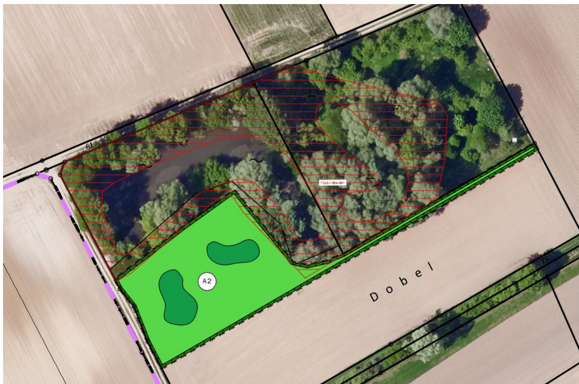
Flachlandbiotopkartierung - Bayernatlas

Lediglich auf der externen Ausgleichsfläche Fl.Nr. 76, Gemarkung Haunersdorf ist die Biotopfläche 7242-1006-001 „Ufergehölze an Abbaugewässern westlich von Lailling“ um das vorhandene Stillgewässer dargestellt. Diese Darstellung ist allerdings nicht flächenscharf, nach aktuellen Standortbegehungen wurden keine Biotopstrukturen auf den beplanten Flächen vorgefunden. Es wird ausschließlich in Intensivgrünland und Ackerflächen eingegriffen.