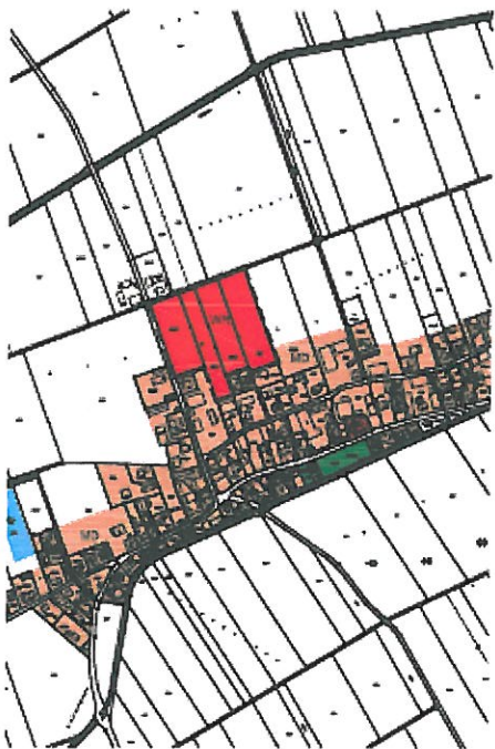
Berichtigung Flächennutzungsplan (Ausschnitt)