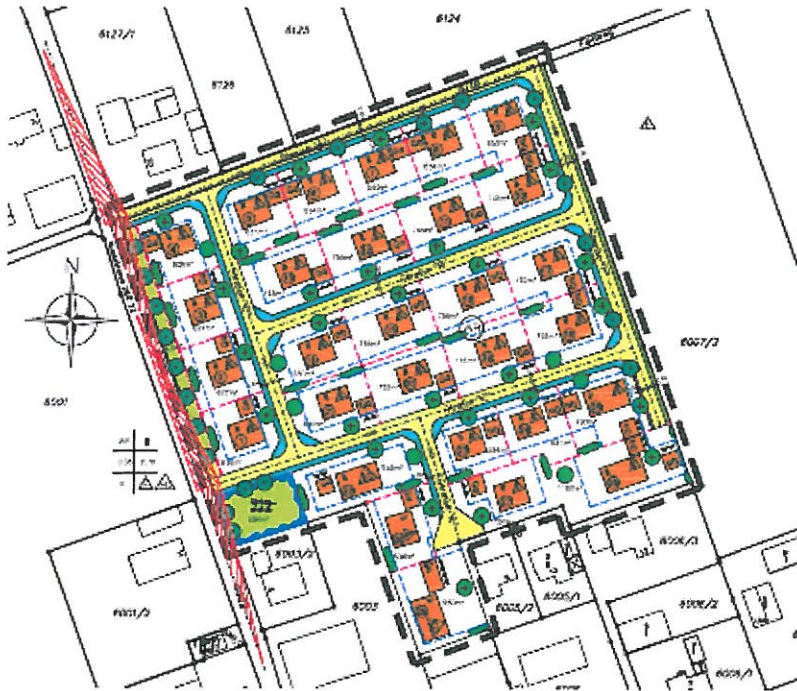
Geltungsbereich Bebauungsplan „WR Dorfäcker Ost“ Lailling

und nicht hätte kennen müssen und deren Inhalt für die Rechtmäßigkeit des Bauleitplans nicht von Bedeutung ist.