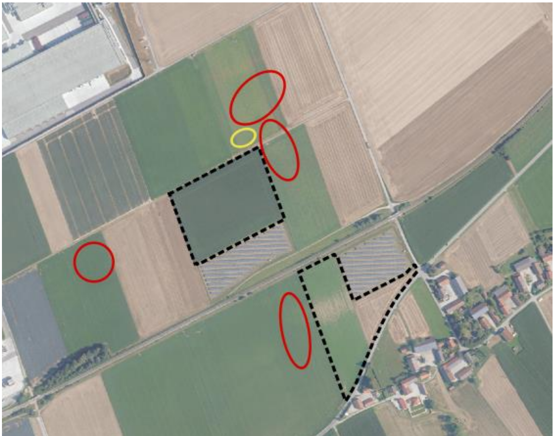
Abb.: Lage der erfassten Feldvogelreviere. Rot: Feldlerche, gelb: Wiesenschafstelze.

Wenige Meter nördlich der nördlichen Fläche konnte eine Wiesenschafstelze festgestellt werden. Hier wird von einem Revier ausgegangen.