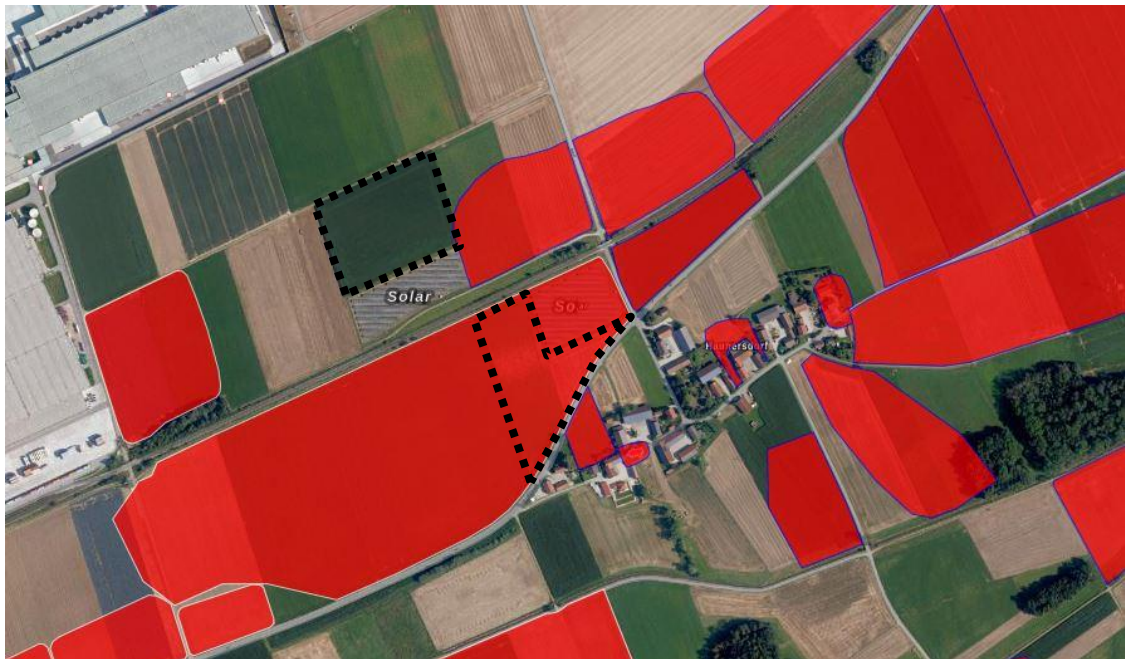
Abb.: Luftbild mit der Lage der Bodendenkmäler im Planungsgebiet

Vorrangig ist beim Bau darauf zu achten, die Bodeneingriffe zu minimieren. Da die Bodendenkmäler in der Regel nur von einer dünnen Schicht Mutterboden bedeckt sind, sind Verletzungen dieser Schutzschicht durch die Bauarbeiten selbst zu vermeiden. Das bedeutet, dass nur der Einsatz von Fahrzeugen mit Kettenlaufwerken zulässig ist. Wo dies nicht möglich ist, muss das Bodendenkmal großflächig von Fachleuten ausgegraben werden. Zutage tretende Bodendenkmäler müssen fachgerecht freigelegt und dokumentiert, sowie die Funde geborgen werden. Diese Arbeiten müssen unter Fachaufsicht des Bay. Landesamtes für Denkmalpflege und der Kreisarchäologie Deggendorf erfolgen. Dabei sind die Grabungsrichtlinien des Bay. Landesamtes zu beachten. Sämtliche Auflagen und Kosten sind vom Maßnahmenträger durchzuführen.