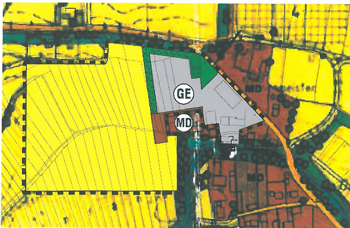
Abb. „Gewerbegebiet Oberpörlingermoos“

Gemäß § 6 Abs. 5 BauGB tritt die Änderung des Flächennutzungsplanes mit der Bekanntmachung in Kraft.