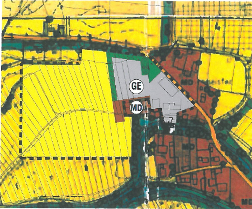
Abb. Flächennutzungsplanänderung „GE Oberpörringermoos“