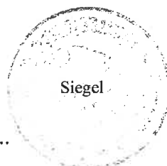
..... Stoiber, 1. Bürgermeister