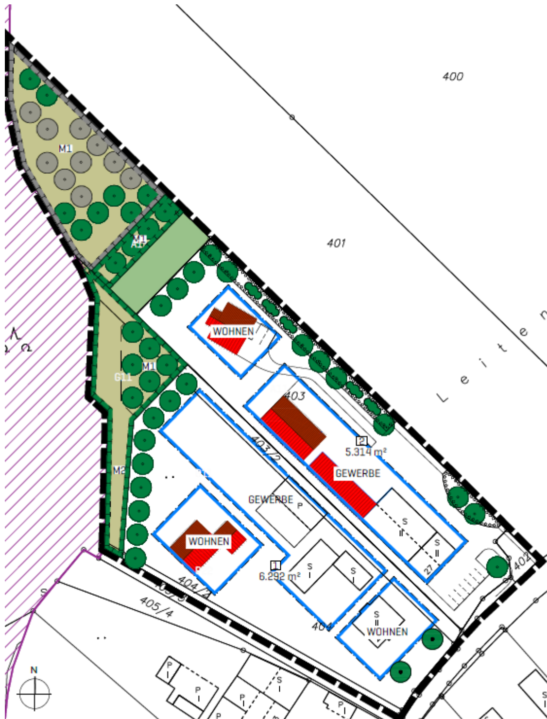
Abbildung 3: Ausschnitt BBP

Das Mischgebiet beinhaltet zwei Bauparzellen bzw. zwei nicht störende Gewerbebetriebe, die jeweils von der Plattlinger Str. aus erschlossen werden. Auf beiden Flächen werden Baufenster definiert, die zum einen dem „Wohnen“ dienen und zum anderen die gewerblichen Gebäude enthalten und den jeweiligen Betrieben die Möglichkeit einer Erweiterung bieten. Die definierten Baufenster „Wohnen“ werden ausgewiesen, um die